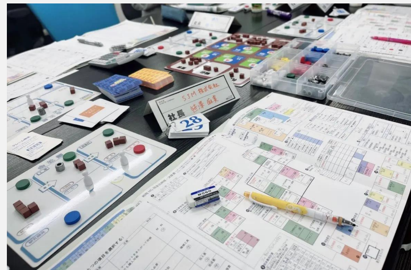
ゲーム盤と現金出納帳