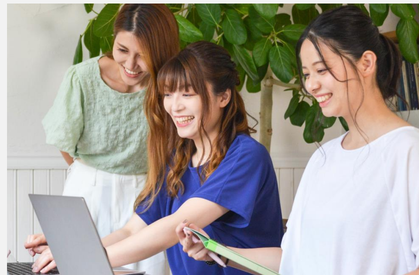
差替予定：育成プログラム風景

詳しい内容に関しても会場について初めて行われるため、緊張感のある育成プログラムを行うことができる。